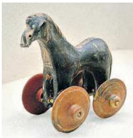
Cavalo de brinquedo da Grécia antiga

próprias crianças a partir de diversos materiais do cotidiano. Na antiga Grécia e Roma, eram utilizadas bonecas articuladas que se moviam através de cordas (semelhantes aos atuais fantoches), bem como miniaturas de objetos da vida cotidiana. Bolas de couro, palha e outros materiais, bonecas de madeira ou barro cozido, cavalos de pau, pássaros presos por cordas, foram multiplicando-se a partir do século XV, e muitos deles tornaram-se no espírito de representação das crianças. Estes brinquedos imitavam as atividades dos adultos, mas eram reduzidos a uma escala mais pequena, à sua escala (como o caso do cavalo de pau, no tempo em que o cavalo era o meio de transporte mais utilizado). As ushabbitis, umas bonecas que mediam entre 10cm e 23cm, eram produzidas em larga