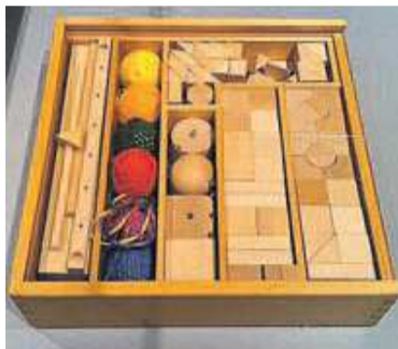
Os Froebel Gifts

e costureiros, os quais a partir do século XV começaram a especializar-se unicamente no fabrico de brinquedos. Os fabricantes de Nuremberga (Alemanha) começaram a ficar famosos pelos seus brinquedos e nos séculos XVI e XVII, Ulm e Augsburg (também na Alemanha), possuíam os melhores criadores de casas de bonecas, miniaturas de instrumentos musicais e peças de mobiliário que se transformaram em obras-primas de artesanato.